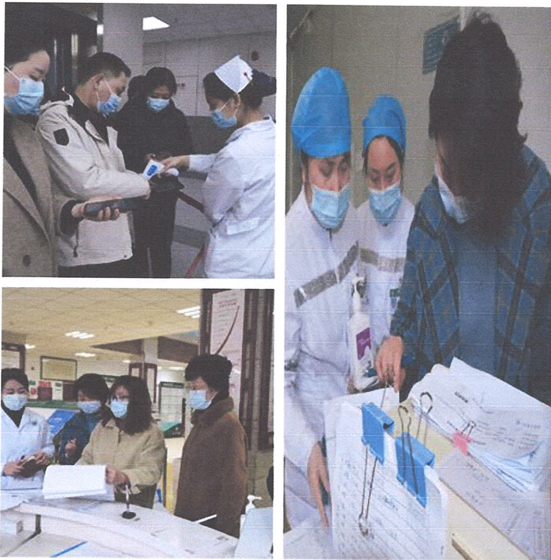
检查组专家对我院疫情防控工作进行现场督导检查